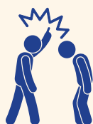
CONDUTAS ABUSIVAS NAS RELACIÓNS ADOLESCENTES

Grazas á carta que unha das súas mellores amigas, Clara, lle fai chegar ao hospital onde está ingresada, desátase ante Mariña o poder inclemente das adiccións, a paradoxal situación que a levará á descuberta da sexualidade propia e un dos segredos mellor gardados pola súa familia: a verdadeira identidade do seu pai.