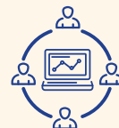
O IMPACTO DAS NOVAS TECNOLOXÍAS NA SOCIEDADE