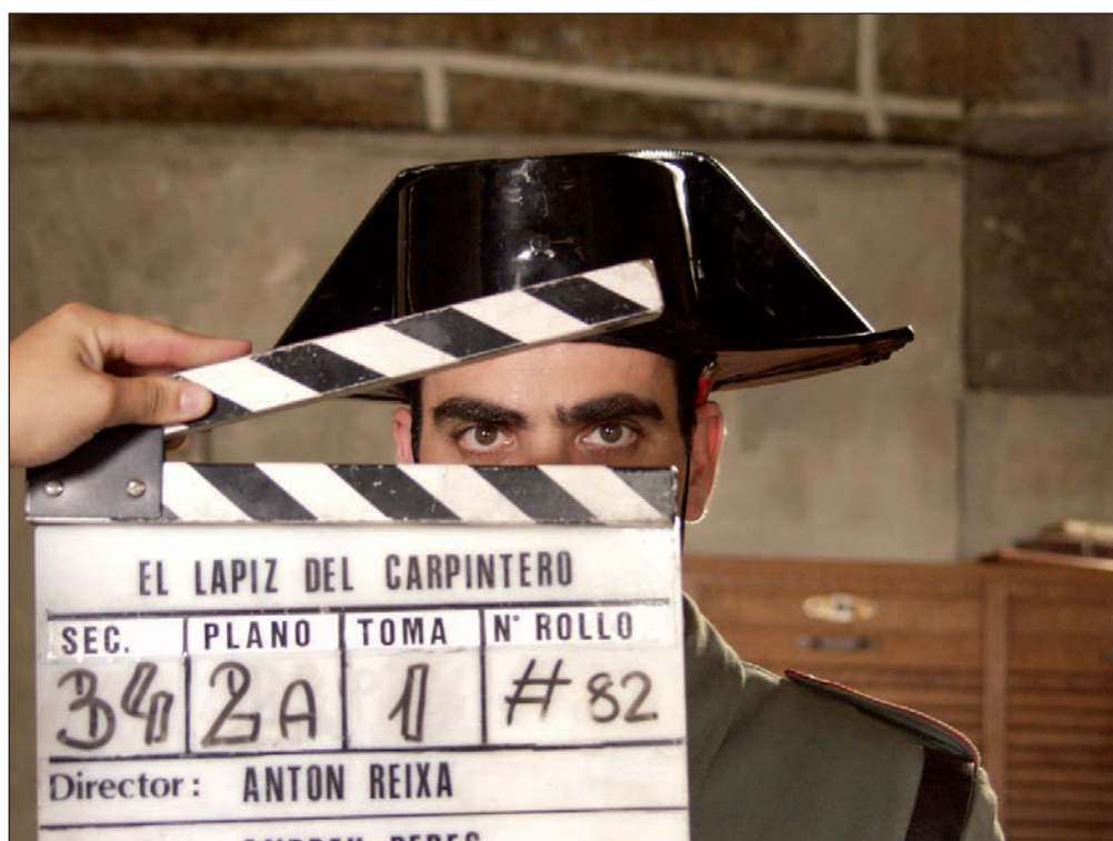
Fotograma de O lapis de carpinteiro , dirixida por Antón Reixa (2003), película baseada na novela homónima de Manuel Rivas

Escribe Wouters: “A memoria humana é extramadamente intrincada. Mesmo os neurólogos están aínda abraiados polo funcionamento da mente. [...] Os historiadores sentimos o mesmo pasmo cando encaramos o funcionamento da memoria. ¿Por qué unha persoa lembra detalles do ano 36 e esquece o que acaba de contar hai cinco minutos? ¿Como é posible que dúas persoas teñan na memoria lembranzas completamente contraditorias e excluíntes do mesmo acontecemento? Existe toda unha “xeoloxía da memoria” [...], unha gama de variacións nas que debemos atopar o noso camiño...” ■