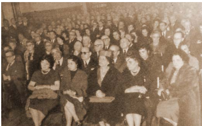
Asistentes a unha conferencia de Otero Pedrayo na Facultad de Filosofía y Letras da Universidade de Buenos Aires ditada no ano 1947