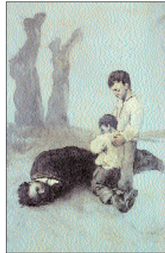
Alfonso R. Castelao, “A derradeira lección do mestre”, Galicia mártir , 1937